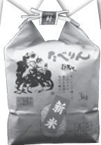
お米 JAあいち三河提供