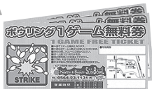
1ゲーム無料券 サンボウル提供