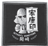
タオル (株)フットジョグ提供