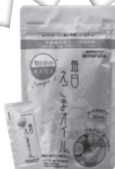
えごまオイル