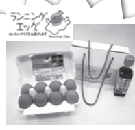
かけ卵セットミニ