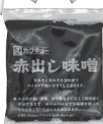
赤出し味噌