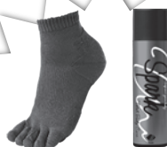
重心ソックス ホディケア スプレー コンドースポーツ提供