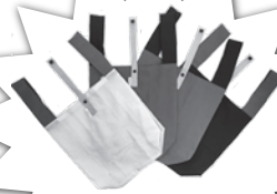
エコバック